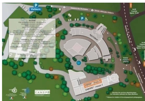
DSDEN 06 au Niveau 0 sur le site du Rectorat de Nice